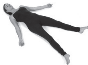
Figura E14. Savasana.