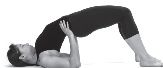
Figura A4. Setu bhandasana.