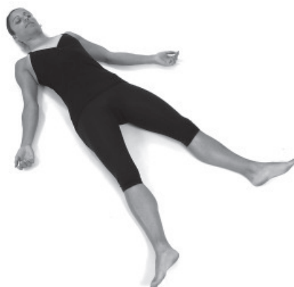
Figura 28. Savasana.