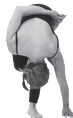
Figura E3. Ardha baddha padmottanasana.