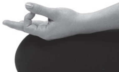
Figura 6. Jñâna mudra .

As mãos repousam na região dos joelhos, em jñâna mudra :