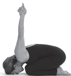
Figura E4. Yoga mudra.