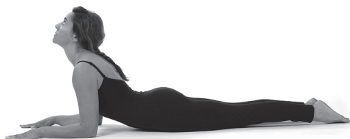
Figura E7. Ardha bhujangasana.