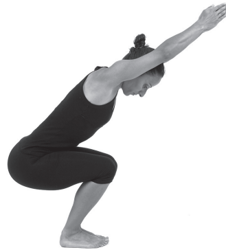
Figura 23. Expiração.