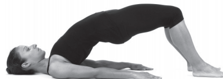
Figura 25. Inspiração.

Imobilização na fase final durante quatro a cinco respirações.