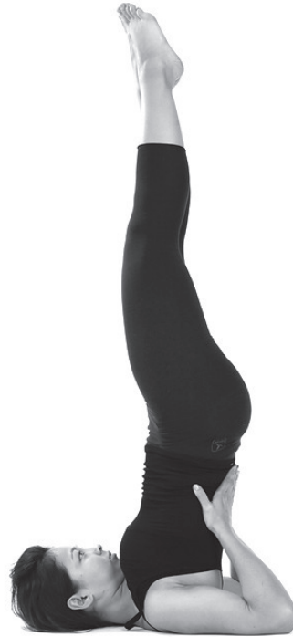
Figura 3. Sarvangasana.