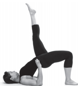
Figura A5. Eka pada setu bhandasana.