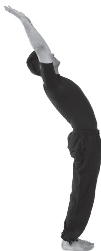
Figura 2. Inspiração.