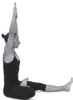
Figura 26. Inspiração.