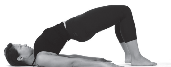
Figura A3. Dvipada pitham