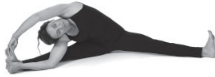
Figura E9. Paravritti janusirasana.