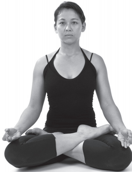
Figura 5. Padmasana.