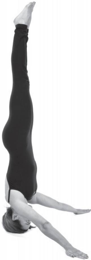
Figura E12. Sirsasana (variante).