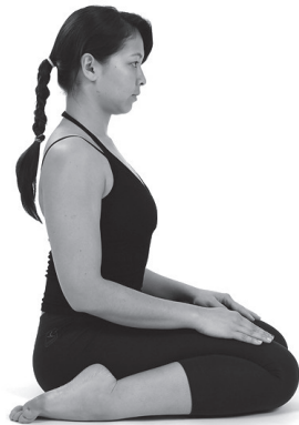
Figura 4. Virasana .