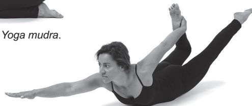
Figura E5. Eka pada hasta uttana vakra ardha dhanurasana.