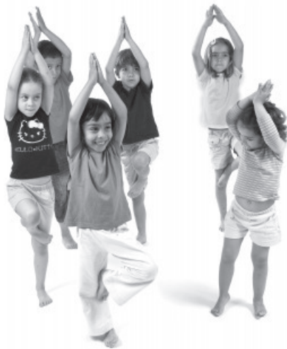
Figura 9. Postura da árvore: Vrikshasana .

Apoiar-se sobre uma perna e, crescendo com os braços acima da cabeça, equilibrar-se com respiração completa (no início é um pouco difícil coordenarem as posturas com a respiração, mas progressivamente vão conseguindo). Depois, fazer o mesmo com a outra perna.