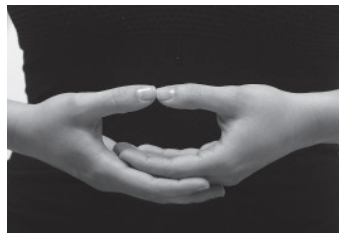
Figura 7. Dhyâna mudra .

Ou repousam dois dedos abaixo do umbigo, em dhyâna mudra :