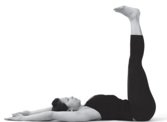
Figura A2. Urdva prasarita padasana.