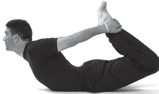
Figura 15. Dhanurasana.

É a postura que vai anteceder a principal desta sequência e serve de teste à amplitude da curvatura das costas, já que há um trabalho dos músculos das costas idêntico. Deitar de bruços, flectir as pernas e segurar os tornozelos ou o peito dos pés com as mãos. Fazendo uma fase dinâmica três vezes, erguer o tronco, inspirando, puxando os pés para trás e para cima, e baixando na expiração.