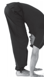
Figura 3. Expiração.