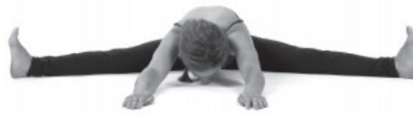
Figura E10. Upavista konasana.