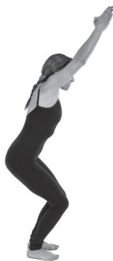
Figura E1. Utkasana.