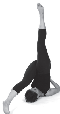
Figura A6. Eka pada sarvangasana.