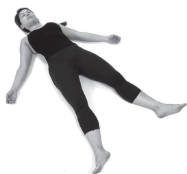
Figura A1. Savasana.

Em relação às séries de posturas aqui apresentadas, observa-se, por exemplo, que na série A se pretende chegar a uma postura de inversão (neste caso, sarvangasana ou niralamba sarvangasana ). A estratégia seguida é a de abordar um nível progressivo de inversão da polaridade. Nessa linha de progressão está incluída uma preparação física, espacial e energética, por meio das várias posturas, que encaminham o aluno em direcção à postura escolhida. As restantes âsana , nesta série, desempenham o papel de posturas de compensação e de complementaridade.