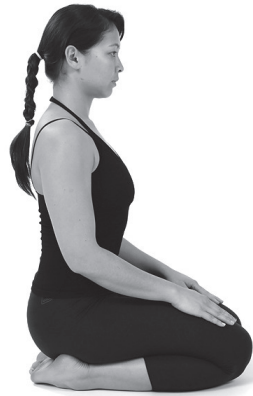
Figura 5. Vajrasana .

A razão pela qual o Oriente recomenda este tipo de posturas, com as pernas cruzadas ou dobradas, está relacionada com o facto de que existem nos tendões e nas cápsulas articulares, e também nos músculos (embora em menor quantidade), receptores especializados na medida do estado de tensão e distensão das fibras que os rodeiam. Estes receptores estão directamente ligados à substância reticular situada ao nível da nuca, no bolbo raquidiano. Ora, quando existe distensão, esta substância reticular é activada e o cérebro desperta. O papel desta substância reticular é o de ser uma espécie de “termóstato” do estado de vigília ou de sono do cérebro. 82