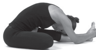
Figura 27. Expiração.

Repetir três vezes a fase dinâmica. Imobilização na fase estática durante quatro a cinco respirações. Executar a postura para ambos os lados.