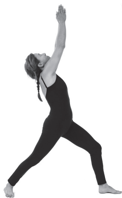
Figura E2. Virabhadrasana (1).