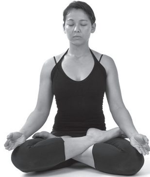
Figura 2. Padmasana .